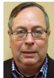
Piet Van San Commissaire national à la littérature