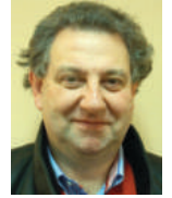
Luc Selis Commissaire national entiers postaux

Carte postale avec timbre 5ct à usage national, émise le 1 er janvier 1873. La carte a été postée à Liège St-Léonard, un quartier au nord de la ville de Liège, le 2 décembre 1875 à 21h00.